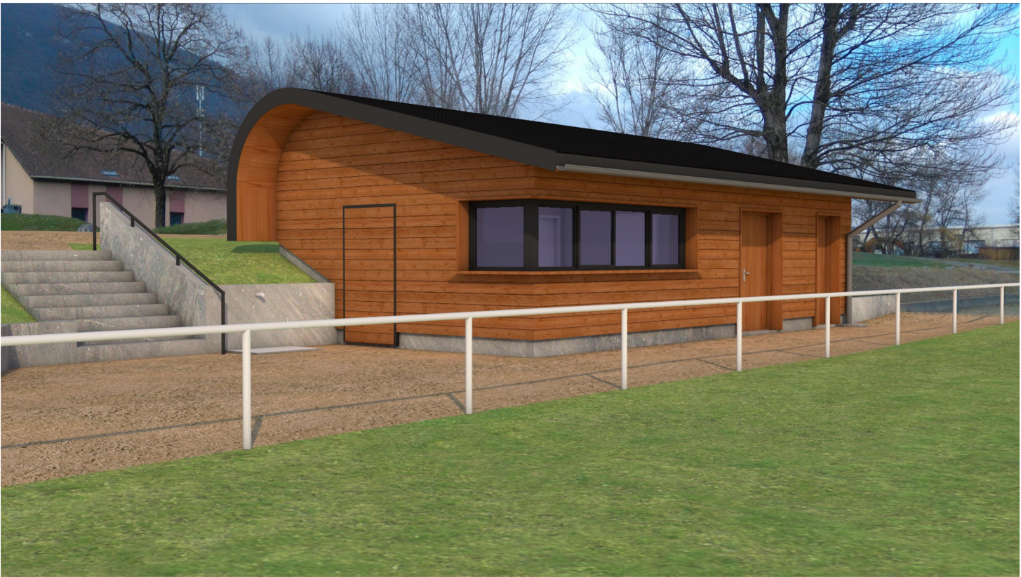
VUE SUD - Insertion du projet de construction dans son environnement